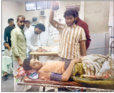
पुलिस की गोली से घायल हुआ आरोपी।