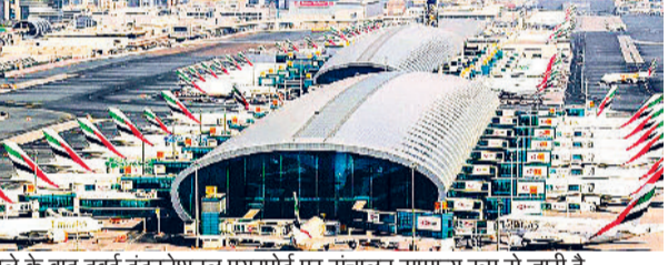
हमले के बाद दुबई इंटरनेशनल एयरपोर्ट पर संचालन सामान्य रूप से जारी है