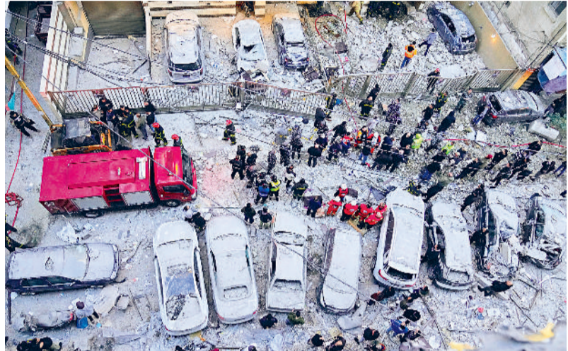
इजराइल का लेबनान की राजधानी बेरुत पर मिसाइल से हमला, इमारतें और वहां खड़ी कारें क्षतिग्रस्त

मिडिल ईस्ट में इजराइल और ईरान के बीच जारी युद्ध ने अब इंफ्रास्ट्रक्चर और आर्थिक लक्ष्यों को निशाना बनाना शुरू किया है। ईरानी मीडिया ने रिपोर्ट किया है कि गूगल, माइक्रोसॉफ्ट समेत कई अमेरिकी टेक कंपनियों के ऑफिस और इंफ्रास्ट्रक्चर ईरान के नए हमले की सूची में शामिल हैं। ईरान की इस्लामिक रिवाल्यूशनरी गार्ड कॉर्प्स (आईआरजीसी) से जुड़ी तस्नीम न्यूज एजेंसी ने इन कंपनियों की सूची जारी की है, जिन्हें ईरान के नए लक्ष्य बताया गया है। इस सूची में गूगल, माइक्रोसॉफ्ट, पलॉटि, आईबीएम, एनवीडिया और ओरेकल जैसी कंपनियां शामिल हैं। इनके ऑफिस इजराइल के कई शहरों और कुछ खाड़ी देशों में स्थित हैं। रिपोर्ट में कहा गया है कि इन कंपनियों की तकनीक का इस्तेमाल इजराइल के सैन्य उद्देश्यों के लिए किया जा रहा है। तस्नीम ने लिखा कि क्षेत्रीय युद्ध के दायरे में इंफ्रास्ट्रक्चर युद्ध शामिल होने के साथ ईरान के वैध लक्ष्यों का दायरा भी बढ़ रहा है। ईरान ने अमेरिका और इजराइल से जुड़े आर्थिक केंद्रों और बैंकों को भी निशाना बनाने की चेतावनी दी है। खातम अल-अंबिया मुख्यालय (जिस संयुक्त राष्ट्र आईआरजीसी से जुड़ा बताया है) के प्रवक्ता ने कहा कि दुश्मन ने हमें अमेरिका और जायोनो शासन से जुड़े आर्थिक केंद्रों और बैंकों को निशाना बनाने की खुली छूट दे दी है। उन्होंने चेतावनी दी कि क्षेत्र के लोगों को ऐसे बैंकों के एक किलोमीटर के दायरे में नहीं रहना चाहिए। टेक कंपनियों के मिडिल ईस्ट में ऑफिस, जैसे गूगल का दुबई में मुख्यालय और माइक्रोसॉफ्ट का यूएई में प्रमुख कार्यालय, अब खतरों में हैं।